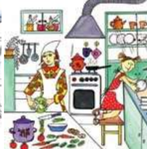
Дочка помогает маме готовить