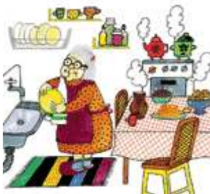
Бабушка готовит обед