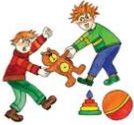
Отнимать игрушку у других детей