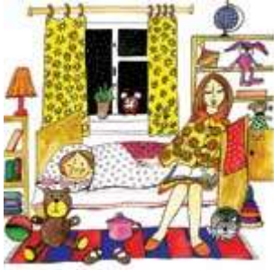
Мама читает дочке книгу на ночь