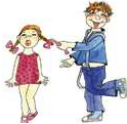
Дергать за косички