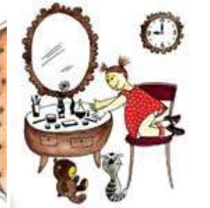
Дочка красится маминной косметикой