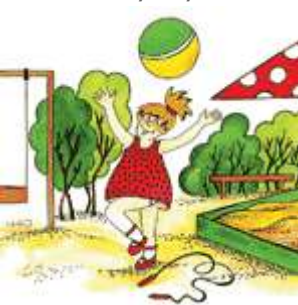
Девочка играет с мячом