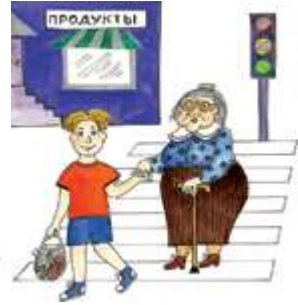
Переводить старушку через дорогу