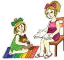
Читать книжку маленькой девочке