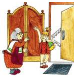
Девочка идет гулять