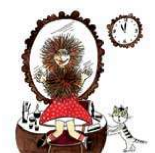
Дочка делает прическу