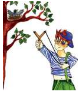
Стрелять из рогатки