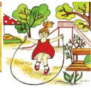
Девочка прыгает через скакалку