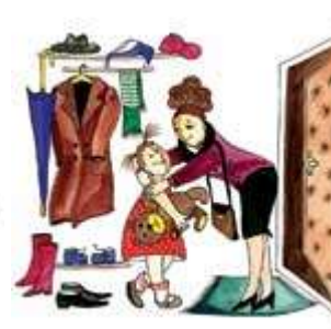
Мама одевается и прощается с дочкой