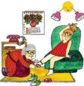
Бабушка разувает внучку