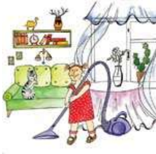
Дочка помогает пылесосить квартиру