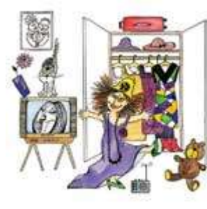
Дочка меряет мамины платья