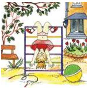
Девочка играет во дворе