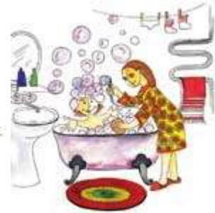
Мама моет дочку