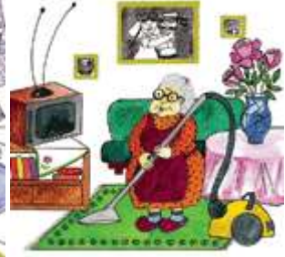
Бабушка убирается в квартире