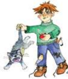
Дергать кота за хвост