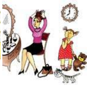
Мама собирается на работу